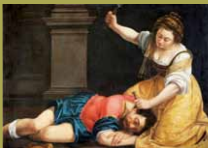
Artemisia Gentileschi, »Jaël und Sisara«