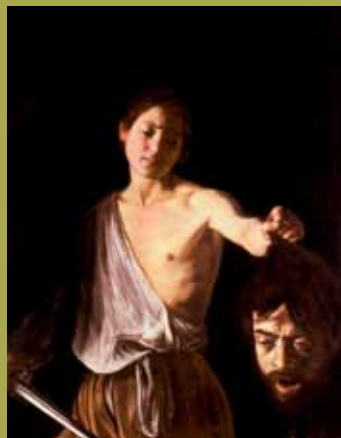
Caravaggio, »David mit dem Haupt des Goliath«

Diese klassische Technik der Ölmalerei wird mit Bildbeispielen unterlegt; wir betrachten und analysieren Farbe, Komposition und Technik großer Meister wie Michelangelo Merisi da Caravaggio, Artemisia Gentileschi, Jacques-Louis David und Anton von Werner.