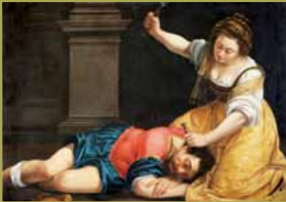
Artemisia Gentileschi, »Jaël und Sisara«