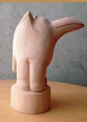
Arbeit eines Kurstteilnehmers, 13 Jahre

Durch kleine Gruppen (max. 4 Schüler) ist ein guter Lern- und Arbeitsprozess möglich. Die Betreuung ist individuell je nach Stand der Kenntnisse und Fähigkeiten des Schülers. Ich begleite Sie vom Holzrohling bis zur fertigen Skulptur.