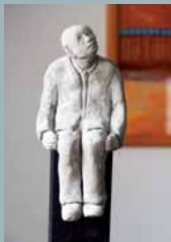
Werke aus Beton von KursteilnehmerInnen

Eine individuelle Beratung und Begleitung ist selbstverständlich.