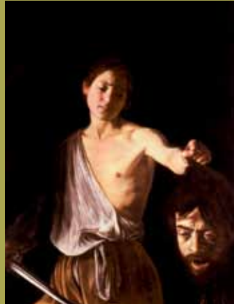
Caravaggio, »David mit dem Haupt des Goliath«

Diese klassische Technik der Ölmalerei wird mit Bildbeispielen unterlegt; wir betrachten und analysieren Farbe, Komposition und Technik großer Meister wie Michelangelo Merisi da Caravaggio, Artemisia Gentileschi, Jacques-Louis David und Anton von Werner.