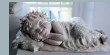
Werk aus Acryl von einer Kursteilnehmerin